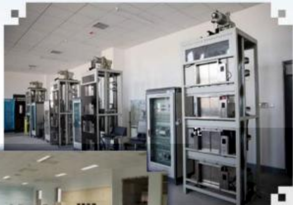
智能电梯安装调试维护训练场所