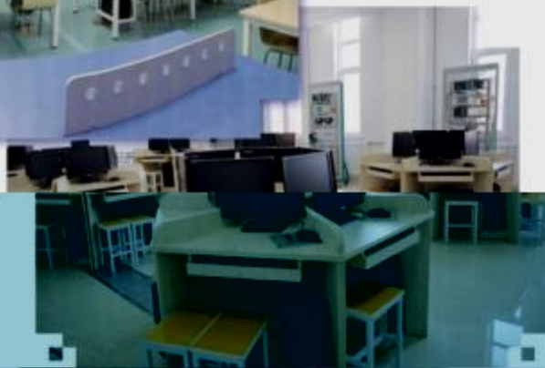
一体化课程教学设计综合实训室